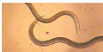
Nematoden 400-fach vergrößert

Nematoden sind sehr wirksam zur Bekämpfung von Schadinsekten. Die mikroskopisch kleinen Würmer infizieren das Schadinsekt und töten dieses innerhalb von 2–3 Tagen ab. Innerhalb des Kadavers des Schadinsekts, vermehren sich die Nematoden und durchlaufen mehrere Entwicklungsstadien. Mit Verbrauch der Nahrungsgrundlage, dem Schadinsekt, entsteht eine weitere Nematoden-Generation die weitere Schadinsekten infizieren kann.